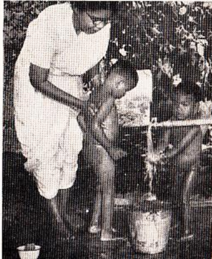
स्वच्छतेचा धडा मौजमजेचा !